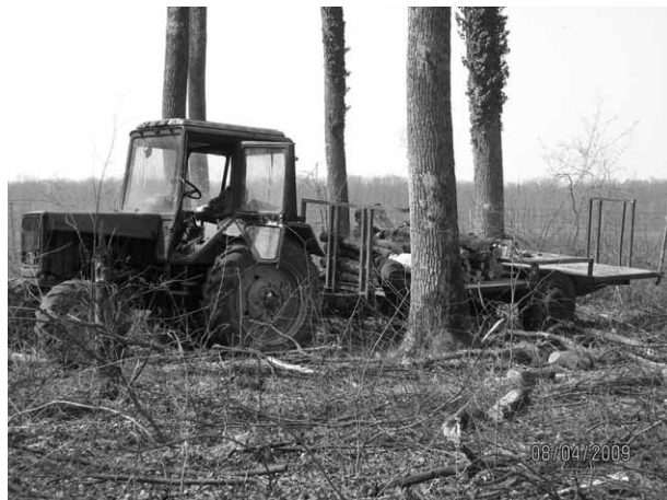
Slika 2. Prijevoz jednometarskoga ogrjevnoga drva traktorskom ekipažom

2. metoda: Krajem ožujka i početkom travnja, nakon rušenja stabala, izrađena je tehnička oblovina i višemetarsko drvo koji su zajedno voženi forvarderom na pomoćno stovarište. U sljedećem je koraku, angažiranjem privatnoga poduzetnika, izrađeno jednometarsko ogrjevno drvo koje je voženo traktorskom ekipažom, kako pokazuje slika 2. U trećem je