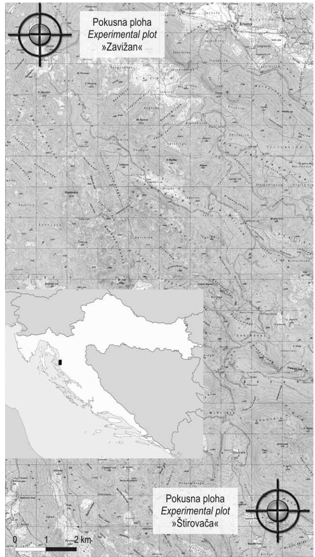
Slika 1. Položaj pokusnih ploha na sjevernom Velebitu Fig. 1 Arrangement of experimental plots in the North Velebit area

Istraživanjem omjera zimujućih imaga smrekova pisara na dvjema poredbenim lokacijama u smrekovim šumama sjevernoga Velebita željelo se u našim uvjetima testirati spoznaju o zimujućoj populaciji u šumskoj stelji, njezinu udjelu u cjelokupnoj populaciji smrekova pisara i mogućnost da taj omjer u visinskom smislu odgovara gradijentu promjene prostorne niše