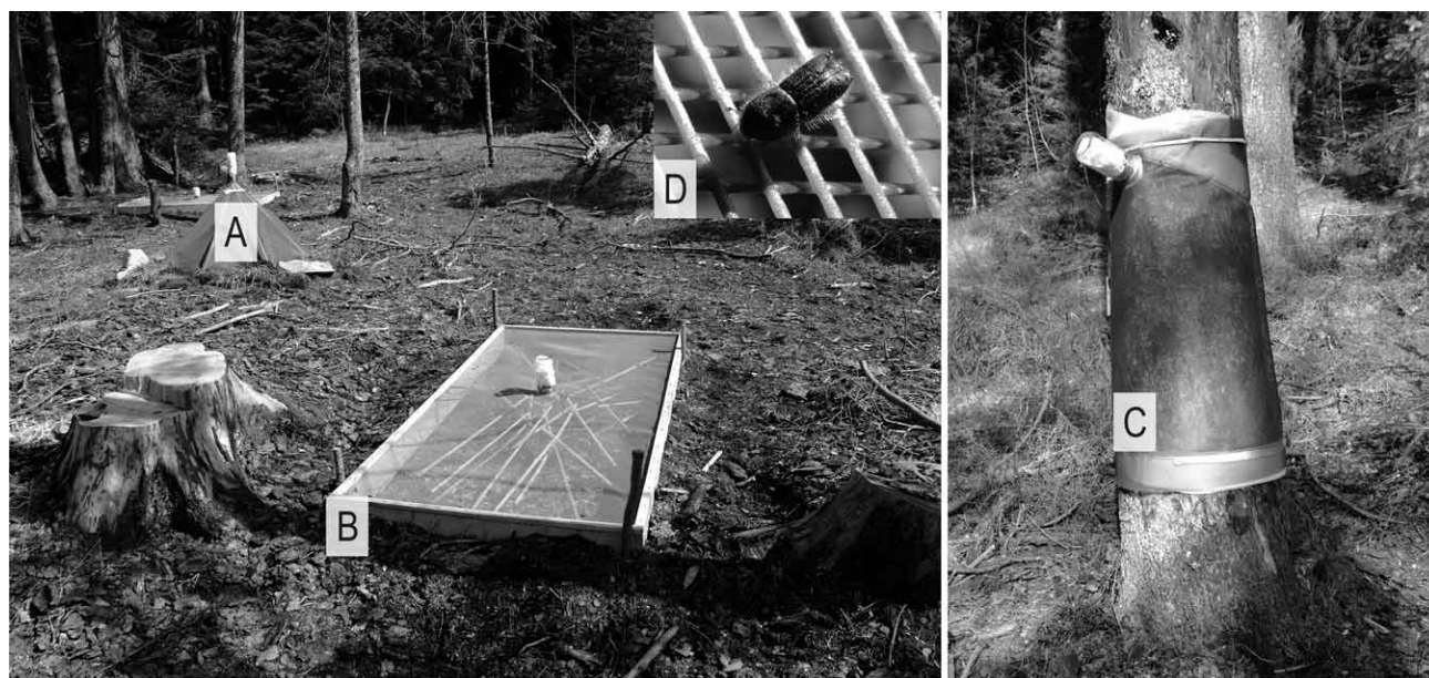
Slika 2. Stožasti (A), pravokutni (B) i cilindrični (C) tip eklektora na pokusnoj plohi »Štirovača«. Detalj (D) prikazuje smrekova pisara na plastičnoj mreži eklektora Fig. 2 Conical (A), rectangular (B) and cylindrical (C) eclector on the »Štirovača« experimental plot. Detail (D) shows eight toothed spruce bark beetle on the eclector plastic net

kore na donjim partijama smrekovih debala u kojoj su registrirana zimujuća imaga smrekova pisara. Pri odabiru pokusnih ploha odabrane su površine podjednako velikih žarišta i recentnih, prošlogodišnjih napada. Također su se nastojala pritom obuhvatiti dva različita visinska pojasa tako da je između niže plohe u Štirovači (područje Petrašice; 44°40'52,56" sjeverne geografske širine, 15°4'12,90" istočne geo-